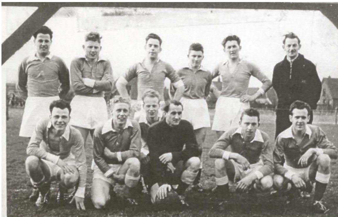
S.V.V.N. 1 1956-1957.