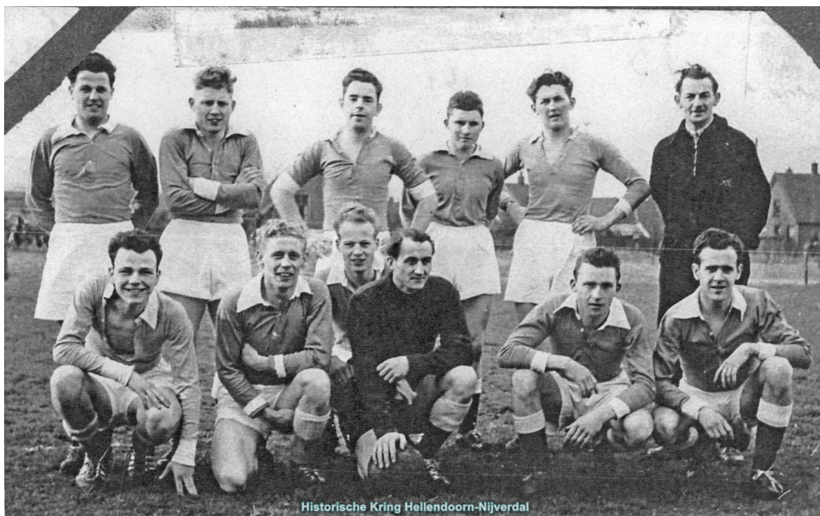
Historische Kring Hellendoorn-Nijverdal